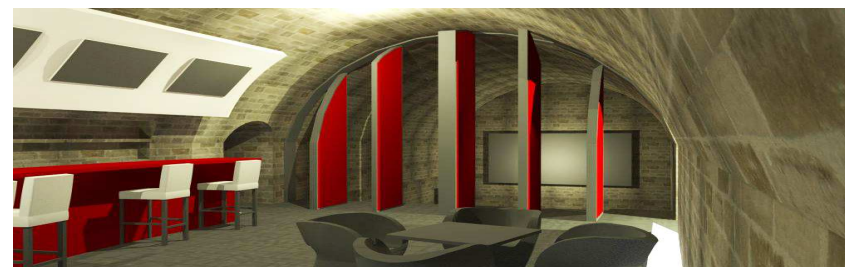
Bar vers scène (cloison ouverte)