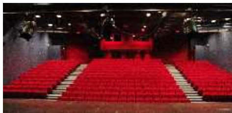
Vue sur la Salle